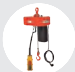
TALHA DE CORRENTE MODELO COMPACT Pág. 117