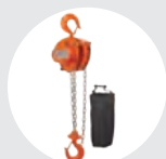
POLIAS MANUAIS SÉRIE 630 Pág. 20