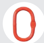
ARGOLA OVALADA Pág. 74