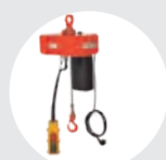
PALANS À CHAÎNE ÉLECTRIQUES MONOPHASES MODÈLE COMPACT Pag. 117