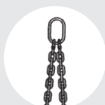
LINGA "DO" Pág. 80