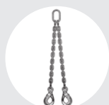
ÉLINGUE "DOL" Pag. 80